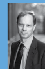
Jean TIROLE, Président TSE

Aussi, nous saisissons cette occasion pour vous remercier sincèrement pour votre soutien constant en 2012 et nous vous souhaitons beaucoup de succès dans tous vos projets au cours de cette année 2013 !